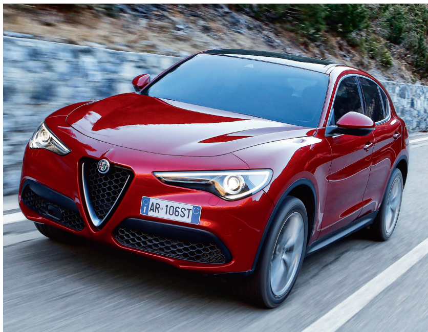
Bei der Wertentwicklung weist mit dem Stelvio der neueste Alfa Romeo und zugleich ein SUV den stabilsten Verlauf auf.

Nur wenige Automobilhersteller haben eine so bewegte Geschichte aufzuweisen wie Alfa Romeo. Und auch wenn die 1910 gegründete Traditionsmarke in den 1930er Jahren zur Nutzfahrzeugproduktion gezwungen war, schlug das Herz der „Anonima Lombarda Fabbrica Automobili“ stets für den Sport.